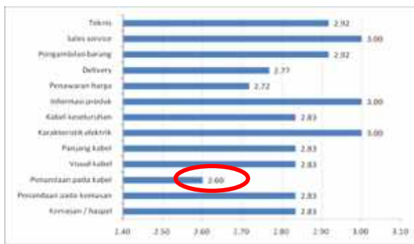
Gambar 2. Grafik evaluasi kepuasan pelanggan Tahun 2014-2016

Pada tahun 2014- 2016 telah dilakukan questioner terhadap 200 perusahaan pelanggan atau kurang lebih 500 orang.