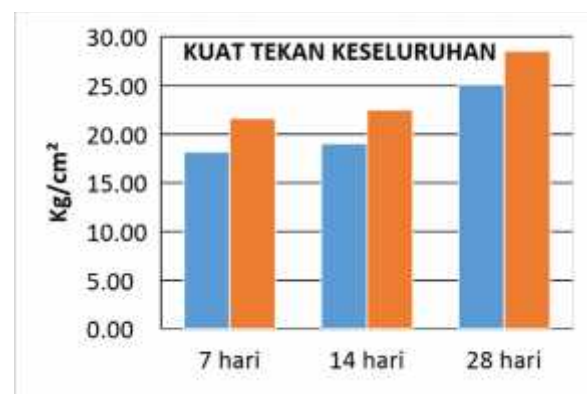
Gambar 6. Kuat Tekan Batako Keseluruhan

Secara keseluruhan perubahan nilai kuat tekan dan daya serap dari batako normal dengan batako variasi laterit (50%) mempunyai perbedaan (Gambar 6). Untuk nilai kuat tekan rata-rata yang dihasilkan dari batako normal sebesar 18.17kg/cm 2 , sedangkan untuk batako dengan variasi laterit 50% diperoleh kuat tekan sebesar 21.63 kg/cm 2 , pada umur batako 7 hari. Sedangkan pada umur 14 hari diperoleh 19.04 kg/cm 2 pada batako normal dan 22.5 kg/cm 2 untuk batako dengan variasi. Untuk batako dengan umur 28 hari diperoleh 25.09 kg/cm 2 untuk batako normal dan 28.56 kg/cm 2 untuk batako variasi.