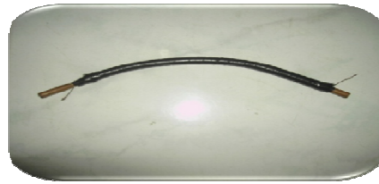
Gambar 4.1 : Gbr Pipa aliran Bahan bakar

Pada bab ini menjelaskan pengaruh pemberian elektron pada aliran input bahan bakar terhadap penghematan bahan bakar dan beberapa pengaruh yng dapat mengakibatkan terjadinya pembakaran lebih sempurna. Uji coba yang dilakukan dengan jarak tempuh 2200 meter dengan jalan mendatar dan kecepatan konstan 30 km/jam. Hal ini dilakukan dikarenakan agar pada saat uji coba didapatkan data yang tetap dengan dapat dilihat perubahan-perubahan yang terjadi pada saat dilakukan uji coba tanpa voltase, dengan voltase 12 volt dan 16 volt.