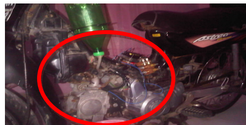
Gambar 4.3 : Rangkaian yg telah di pasang pada kendaraan.