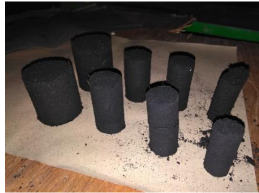
Gambar 1 Briket siap dianalisis

Perubahan fisik briket janjang sawit selama proses pengujian telah dilakukan oleh peneliti. Pengujian dilakukan pada saat sebelum dijemur, sesudah dijemur dan setelah dioven. Pengujian dilakukan untuk menunjukkan perubahan fisik yang terjadi pada briket dengan ukuran briket \frac{1}{2} " , \frac{3}{4} " , 1" dan 1\frac{1}{2} ".