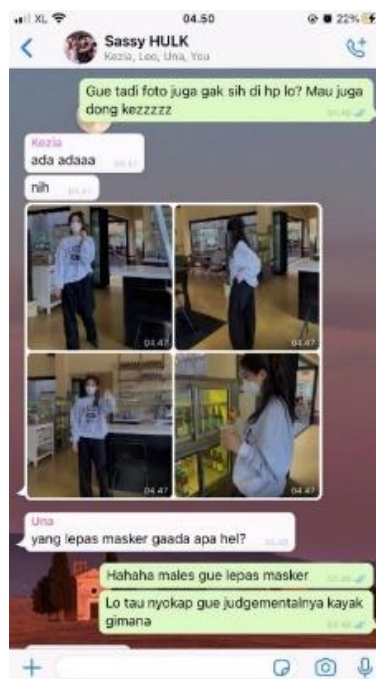
Gambar 7. Hello, Cello

Bagi pembaca AU, membaca kisah-kisah AU dapat memberikan pemahaman tentang kehidupan dan menciptakan rasa dekat dengan para tokohnya maupun kisahnya melalui cerita yang disampaikan. Seperti pada kisah yang dibaca Siska yang berjudul Hello, Cello, yang menceritakan kisah romansa mahasiswa, persahabatan, pertemanan dan masalah keluarga serta percintaan antar tokohnya. Berdasarkan penuturan Siska kisah Hello, Cello menceritakan Cello dalam menemukan cinta sejatinya. Pada kisah AU tersebut ia dipertemukan dengan tokoh bernama Helga yang memiliki tingkat kepercayaan diri yang rendah karena seringnya dikritik oleh ibunya dalam hal penampilan dan dibandingkan dengan adiknya. Selain pengaruh dari keluarga, Helga juga mendapat pengaruh dari teman-temannya yang membuatnya semakin merasa rendah diri, hingga sulit menerima pendapat atau masukan yang membangun dari orang baru, seperti saat Cello yang terlihat mulai mendekati Helga. (Siska, wawancara 25 Juni 2023). Hal ini terlihat pada gambar 7, yang memperlihatkan percakapan di grup WhatsApp milik Helga.