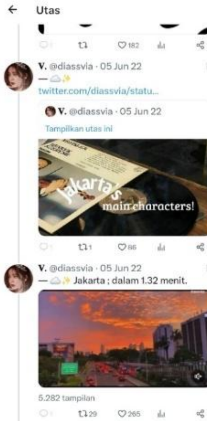
Gambar 3. Bagian awal AU - perkenalan

Seperti pada Gambar 3, penulis membuat utas terpisah khusus untuk mengenalkan karakter tokohnya. Untuk membuat kisah yang dibuat terlihat nyata dan dekat dengan pembaca, penulis acapkali menambahkan elemen lainnya, baik foto, gambar, video, audio-visual, maupun daftar lagu melalui Spotify, untuk memberikan pengalaman se-nyata mungkin dari kisah yang dibuatnya. Seperti ada gambar 4, yang memperlihatkan percakapan antara fans dari Arancione dengan Jakarta (Jaka), pada AU tersebut Jaka digambarkan sebagai seorang penyanyi dan memiliki akun Twitter resmi ( official ) bercentang biru. Terlihat pada gambar 4 hubungan yang akrab antara idol-fans yang ditunjukkan dari aksi saling balas tweet (cuitan).