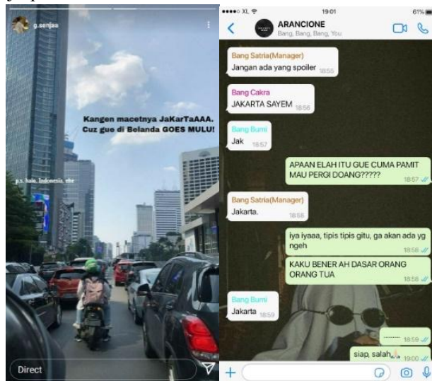
Gambar 5. Bagian Cerita AU

Selanjutnya pada Gambar 5, penulis menyertakan sebuah screenshot Story Instagram yang seolah-olah dibuat oleh tokoh bernama Senja yang baru tiba di Jakarta, serta screenshot percakapan melalui WhatsApp Grup dari idol grup bernama ARANCIONE yang beranggotakan Bang Satria (Manager), Bang Cakra, Bang Bumi, dan Jaka (Jakarta). Melalui penambahan elemen-elemen tersebut, membangun cerita yang seolah-olah mendekati pembaca pada karakter tokoh yang terlibat di cerita. Hal ini menjadikan pembaca merasa dapat berkomunikasi langsung dengan para karakter yang terlibat.