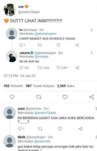
Gambar 4. Bagian Cerita AU

Seperti pada Gambar 3, penulis membuat utas terpisah khusus untuk mengenalkan karakter tokohnya. Untuk membuat kisah yang dibuat terlihat nyata dan dekat dengan pembaca, penulis acapkali menambahkan elemen lainnya, baik foto, gambar, video, audio-visual, maupun daftar lagu melalui Spotify, untuk memberikan pengalaman se-nyata mungkin dari kisah yang dibuatnya. Seperti ada gambar 4, yang memperlihatkan percakapan antara fans dari Arancione dengan Jakarta (Jaka), pada AU tersebut Jaka digambarkan sebagai seorang penyanyi dan memiliki akun Twitter resmi ( official ) bercentang biru. Terlihat pada gambar 4 hubungan yang akrab antara idol-fans yang ditunjukkan dari aksi saling balas tweet (cuitan).