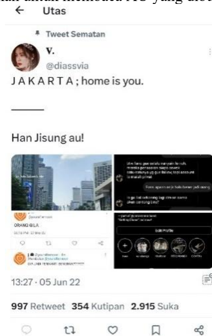
Gambar 2. Prompt atau kepala AU

Penulis menyisipkan penggalan dari gambar, audio, video, dan visualisasi lainnya untuk menarik pembaca dan melanjutkan untuk membaca AU yang dibuatnya.