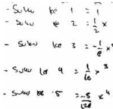
Gambar 3 Perbaikan kesalahan jawaban pertanyaan pertama

Dari aktivitas wawancara, tersebut kemudian MR menunjukkan hasil perbaikannya yang sesuai dengan struktur berfikir soal. Adapun perbaikan jawaban yang dimaksud dapat diamati pada gambar 3