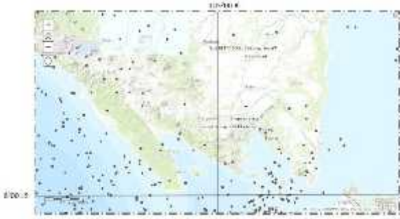
Gambar 2. Sebaran seismisitas di wilayah Provinsi Lampung tahun 1960-2000

Gambar 2 memperlihatkan pemusatan pemusatan gempa di sepanjang tepi Teluk Lampug yang bertepatan dengan garis sesar Lampung-Panjang, terdapat pula pusat gempa yang terletak di lepas pantai yang kemungkinan besar berhubungan dengan lajur Sesar Semangko dan struktur ikutannya. Sedangkan wilayah sebelah barat Provinsi Lampung yang pemusatan gempa bumi bertepatan dengan lajur penunjaman. Pusat gempa tersebut terletak pada kedalaman antara 0-60 km, dengan magnitudo diatas 4 SR. Gempa tersebut berlangsung dengan lajur penunjaman yang ada sekarang. Peristiwa kegempaan terjadi di sepanjang garis lemah di tepi benua yang ditafsirkan sebagai zona batuan alas benua yang tersebar luas secara regional dan mungkin berlanjut ke bawah sampai di lajur penunjaman, akibatnya letak kegiatan seismik dan magmatik tersebar di sepanjang tepi benua.