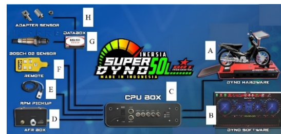
Gambar 3. Rangkaian Instrumen Dyno Test BRT Super Dyno 50L

Gambar 2 adalah piston cembung ( dome piston ) yang sudah dilakukan modifikasi ceramic coating pada bagian crown dan skirt piston .