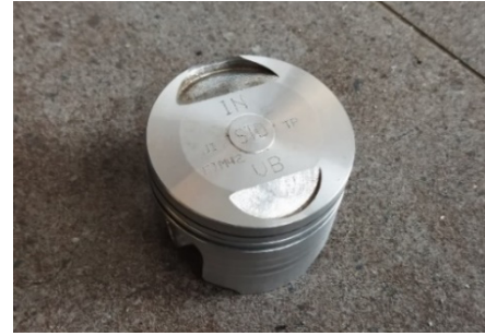
Gambar 1. Piston Modifikasi Cembung ( Dome )

Gambar 1 merupakan piston cembung sebelum diaplikasikan ceramic coating pada bagian crown dan skirt piston .