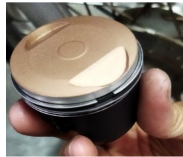
Gambar 2. Piston Modifikasi Cembung Ceramic Coating

Gambar 1 merupakan piston cembung sebelum diaplikasikan ceramic coating pada bagian crown dan skirt piston .