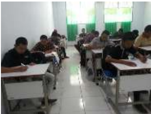
Gambar 4. Pengukuran di Ruang Kuliah (C4) Arsitektur Unisan

Terhadap responden tersebut diberikan kuesioner terkait sensasi termal (TSV), penerimaan kondisi termal dan preferensi kondisi termal.