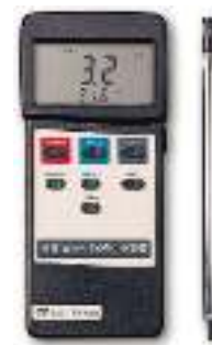
Gambar 2. Alat Ukur Anemometer Hot Wire Merk, Lutron AM-4204