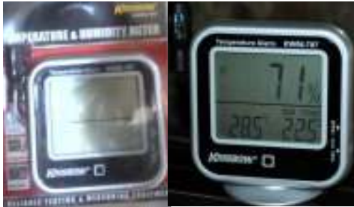
Gambar 3. Alat Ukur Temperatur dan Kelembaban, merk Krisbow type KW06-797