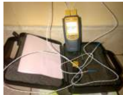
Gambar 1. Alat Ukur Termocoupe Meter Type Double Ways VA 8060