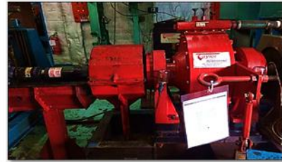
Gambar 2. Taylor Dynamometer DX 34

Peralatan yang digunakan yaitu taylor dynamometer DX34, sebagai berikut :