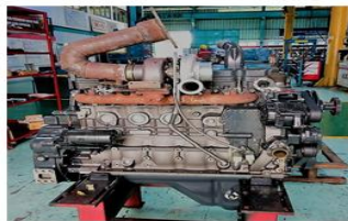
Gambar 1. Engine Komatsu SAA6D107E-1

Obyek penelitian ini adalah engine Komatsu SAA6D701E-1. Spesifikasi dari engine tersebut sebagai berikut :