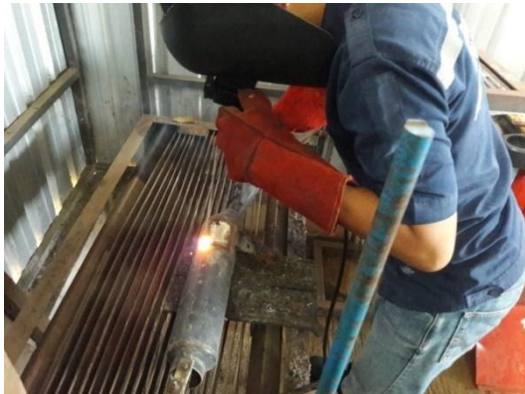
Gambar 2. Proses pembuatan muffler.

tersebut dicari perbedaannya dengan parameter emisi gas buangnya pada CO dan HC yang dihasilkan. Pada Gambar 2, menggambarkan pekerjaan pembuatan muffler, dalam pembuatan muffler ini masih memanfaatkan yang standard dan melakukan perubahan struktur didalamnya kemudian dipasang kembali dengan susunan atau struktur yang berbeda.